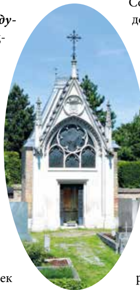
▲ Семейный склеп Ферстелей на кладбище в Гринцинге

Помимо этого, Генрих фон Ферстель преподавал в Высшей политехнической школе Вены. Среди его учеников был, в частности, Август Оттмар Эссенвейн.