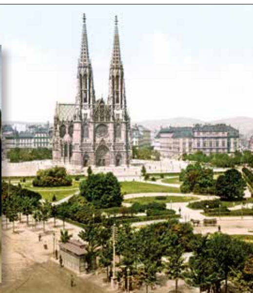
▲ Вотивкирхе, 1900 г. ▶ Внутреннее убранство храма