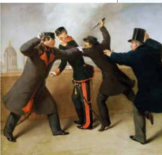
▲ Янош Либени совершает покушение на Франца Иосифа I