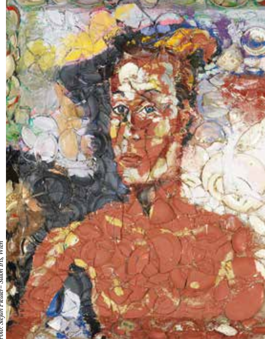
ALBERTINA, Wien – The ESSI Collection © Julian Schnabel

Время работы: ежедневно – с 10 до 18, среда, пятница – с 10 до 21 www.albertina.at