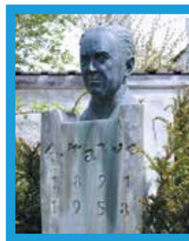
▲ Памятник Вальде в Китцбюэле.

После участия в Первой мировой войне в 1914–1917 годах в составе тирольских императорских стрелков художник вернулся в Китцбюэль, где, кстати, прожил до конца