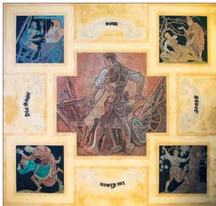
▲ Сцены из легенды про Шток-им-Айзен украшают жилой дом Фогельвайдхоф в 15-м районе Вены.

Едва прослышав об этом, Мартин тотчас же принялся за работу. Но черту, который унес с собой прежний ключ, эта затея пришлась не по нраву. Обернувшись невидимкой, он уселся возле горна, и всякий раз, когда Мартин совал в пламя ключ, чтобы его накалить, черт сворачивал на сторону бородку. Мукс вскоре догадался, откуда ветер дует, и нарочно приставил бородку наоборот, прежде чем сунуть ее в огонь.