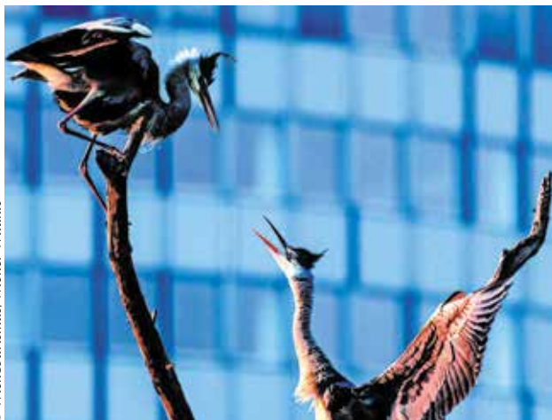
▲ Колония серых цапель свила около 30 гнезд недалеко от автодорожного моста с интенсивным движением в районе Флоридсдорф

На сделанных из-под воды кадрах можно запечатлеть потрясающие виды города», – восторженно утверждает фотограф, когда мы за несколько часов до съемки наблюдаем за колонией серых цапель в водном парке Флоридсдорф. «Серые цапли размножаются даже в городской среде. Довольно легко сделать хороший снимок того, как они строят гнезда, конкурируют между собой или выращивают потомство», – поясняет Георг Попп.