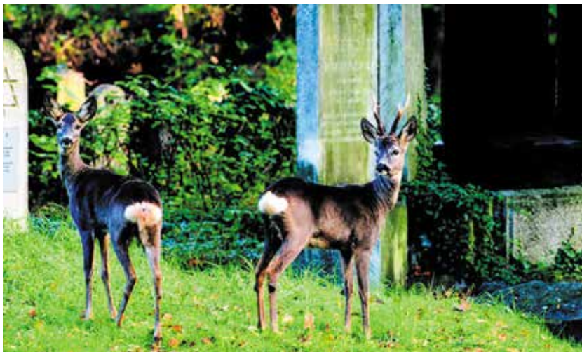
▲ Кроме косулей на Центральном кладбище Вены живут лисы, хомяки и белки