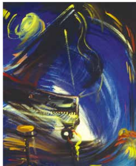
▲ Рояль, 1998

Удивительна ненавязчивая, но тщательно продуманная детализировка каждой сцены, каждого кадра. Нет ничего лиш-