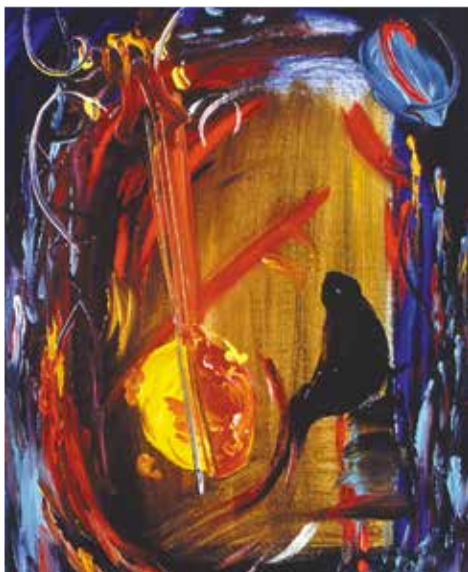
▲ Триптих: Кусочки джаза. Банджо, 1995

Теперь непосредственно о самом фильме. Его композиционная структура, вплоть до отдельных эпизодов, жестко связана с музыкой. Фильм можно условно разделить на 20 (по числу отобранных музыкальных композиций, или, по выражению их автора, звуковых минипьесок) самостоятельных, вполне законченных