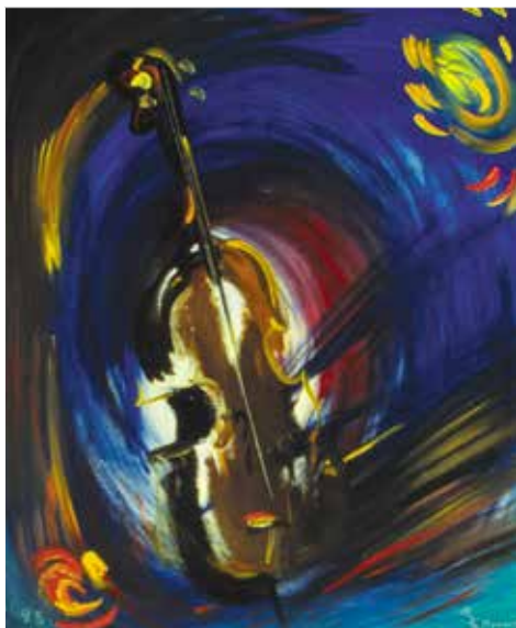
▲ Контрабас, 1998