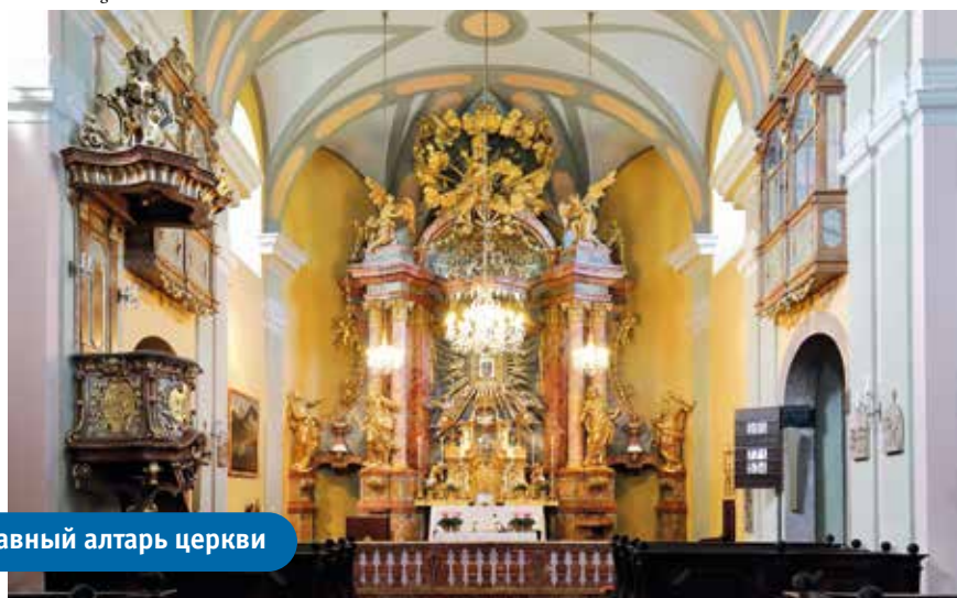
Главный алтарь церкви

Место на Мариахильфберг обычно людное, просторные парковки свидетельствуют о том, что гостей здесь бывает немало. По пути к церкви встречаются несколько ресторанчиков и сувенирных лавок. На фасадах монастыря и церкви изображены гербы ордена сервитов и семьи Хойос.