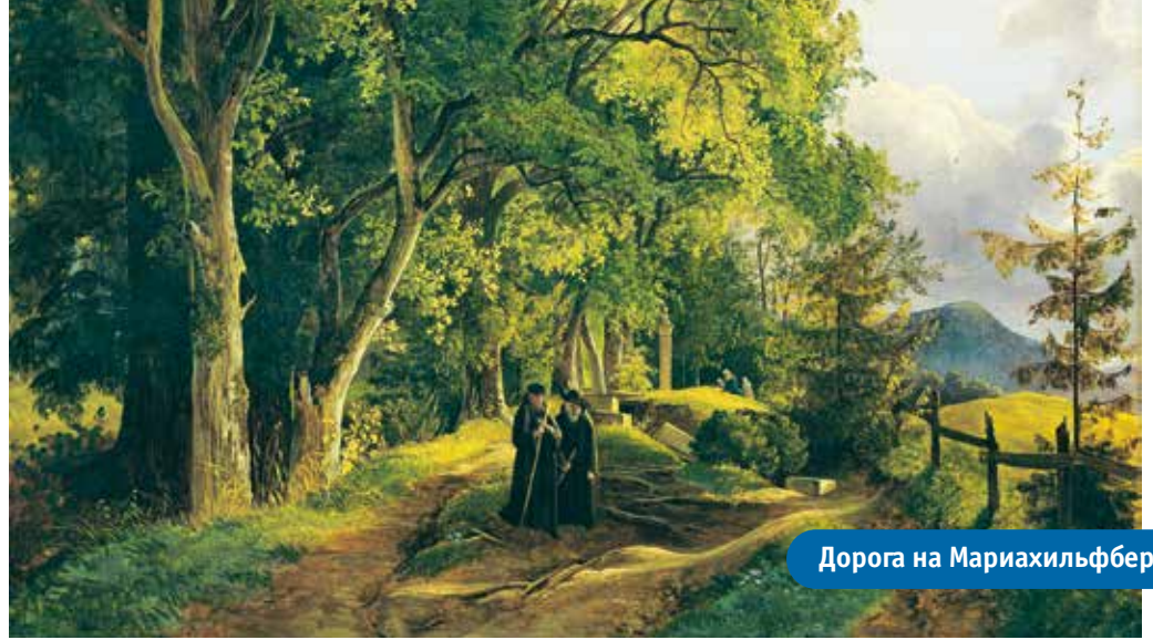
Дорога на Мариахильфберг