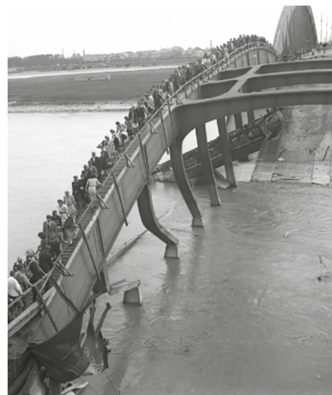
▼ Флоридсдорфский мост, 1945. Жители Вены на временном мосту, возведенном солдатами Красной армии

Много месяцев наши инженерные войска занимались восстановлением моста. По Дунаю плыли суда и баржи, груженные песком, кирпичом, лесом. На обоих берегах стрекотали экскаваторы, сновали вереницы грузовиков, двигались стрелы подъемных кранов. Торжественная передача моста проходила 19 мая 1946 года. На берегах Дуная собрались тридцать тысяч венцев. Впереди колонн шли оркестры. На фермах моста трепетали по ветру красочные транспаранты со словами благодарности советским саперам-строителям. Начался митинг.