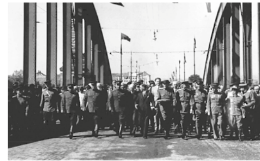
▲ Торжественное открытие Флоридсдорфского моста

Издательства «Глобус» и «Штерн» печатали книги для австрийцев. В Вене открыл-