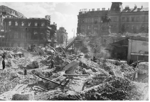
▲ Альбертинаплац, 1945