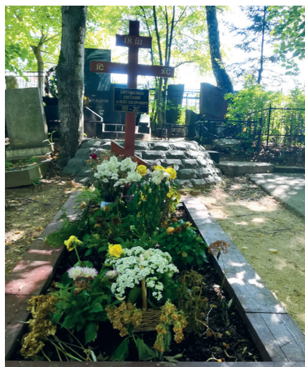
▼ Могила Е. Евтушенко на Переделкинском кладбище

Не печальюсь о смерти и бессмертья не жду. Я не верую в чудо, я не снег, не звезда, и я больше не буду никогда, никогда. И я думаю, грешный, ну, а кем же я был, что я в жизни поспешной больше жизни любил? А любил я Россию всею кровью, хребтом – ее реки в разливе и когда подо льдом, дух ее пятастенок, дух ее сосняков, ее Пушкина, Стеньку и ее стариков. Если было несладко, я не шибко тужил. Пусть я прожил нескладно, для России я жил. И надеждою маюсь (полный тайных тревог), что хоть малую малость я России помог. Пусть она позабудет про меня без труда, только пусть она будет, навсегда, навсегда. Идут белые снега, как во все времена, как при Пушкине, Стеньке и как после меня. Идут снега большие, аж до боли светлы, и мои, и чужие замая следы. Быть бессмертным не в силе, но надежда моя: если будет Россия, значит, буду и я.