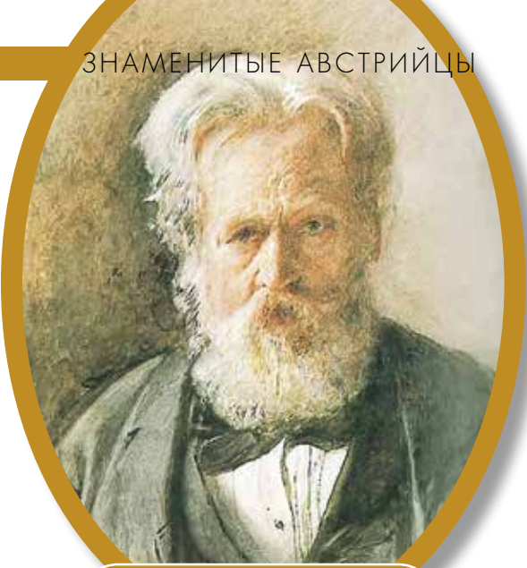
РУДОЛЬФ ФОН АЛЬТ

▼ Памятник Рудольфу фон Альту на Миноритенплац в Вене