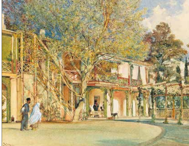
▲ Якобы Бахчисарай. Ошибочно атрибутированная ливадийская акварель Рудольфа фон Альта, 1863

В 1912 году на одной из центральных столичных площадей – Миноритенплац – художнику был установлен памятник, автором которого является скульптор Ганс Шерпе.