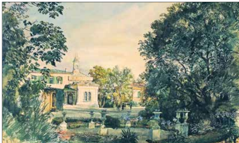
▼ Парк в Ливадии. 1863