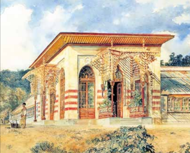
▲ Оранжерея в Ливадии. 1863

Некоторое время Рудольф фон Альт жил и работал в Риме и Неаполе; позже он побывал на озерах Ломбардии, в Галисии, Богемии, Далмации, Галиции, Баварии, а также в России, где написал многочисленные пейзажи.