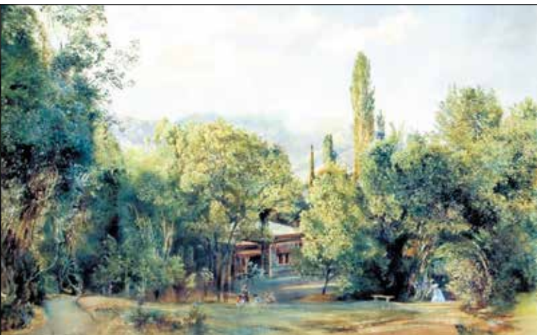
▼ Уголок Ливадийского парка. 1863

Большая часть его картин по сей день выставляется в музеях Вены.