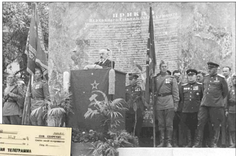
▲ Карл Реннер выступает на открытии Памятника воинам советской армии, погибшим при освобождении Австрии. Вена, 19 августа 1945 года.

И. В. Сталин ответил К. Реннеру: «Благодарю Вас, многоуважаемый товарищ, за Ваше послание от 15 апреля. Можете не сомневаться, что Ваша забота о независимости, целостности и благополучии Австрии является также моей заботой». Он заверил, что готов оказать Австрии любую помощь по мере сил и возможностей.