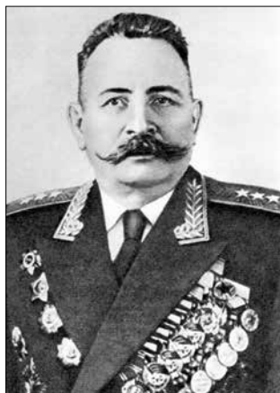
▲ Александр Иванович Шебунин, генерал-полковник интендантской службы

тогда, когда советские люди сами жили на полуголодном пайке среди руин разрушенного врагом хозяйства наших западных районов.