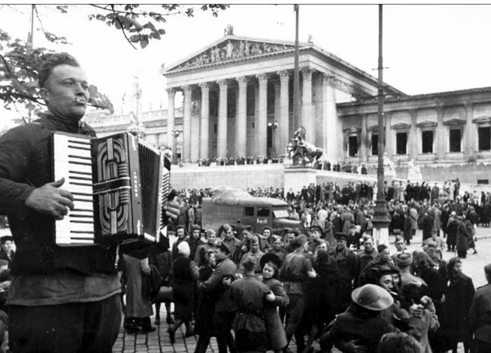
▲ Мирные будни в послевоенной Вене, весна 1945-го