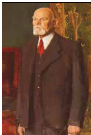
▲ Теодор Кёрнер был назначен советскими оккупационными войсками в Австрии временным бургомистром Вены

Советское командование немало сделало для восстановления нормальной жизни австрийского народа, освобожденного из-под гитлеровского господства. Хочу в заключение подчеркнуть, что все это происходило