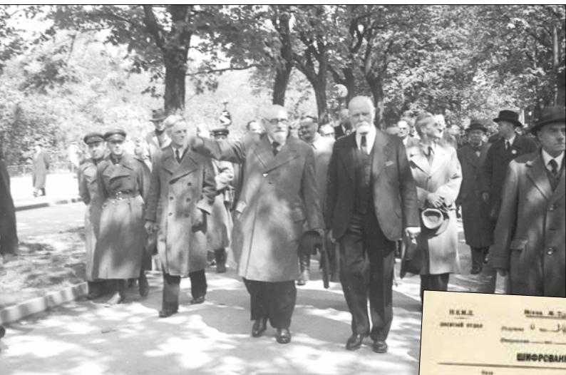
▲ Карл Реннер (в центре) и другие члены правительства направляются к зданию Парламента. Вена, 29 апреля 1945 года.