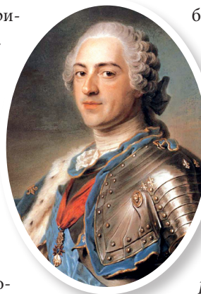
▲ Людовик XV, французский король

В 1774 году оспа настигла 64-летнего Людовика XV (который за несколько лет до этого побрезговал « рябой » венской невестой). Течение