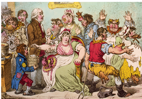
▲ Карикатура на вакцинацию, где привитые якобы становятся внешне похожими на животных

торое вскоре прошло. Затем Дженнер заразил мальчика натуральной (человеческой) оспой. Ничего не произошло. Он повторил эту процедуру через месяц, через два, через год – мальчик оставался здоровым.