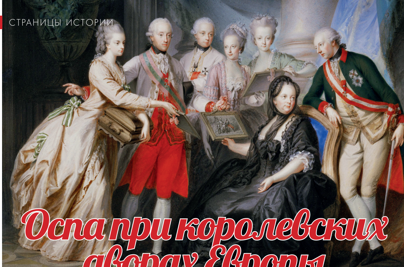
▲ Мария Терезия во вдовьих одеждах с некоторыми из своих взрослых детей