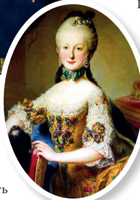
► Эрцгерцогиня Мария Элизабет (1743–1808) до болезни

зеркала, чтобы не видеть уродливые шрамы на своем лице.