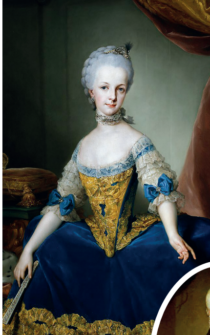
▲ Эрцгерцогиня Мария Йозефа умерла, так и не став королевой Неаполя

Мария Терезия уже приняла предсмертное помазание и исповедовалась. Но чудом выжила и приказала завесить в Хофбурге все