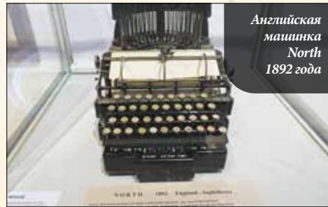
Английская машинка North 1892 года