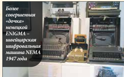
Более совершенная «дочка» немецкой ENIGMA – швейцарская шифровальная машина NEMA 1947 года