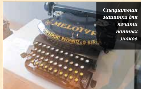
Специальная машинка для печати нотных знаков