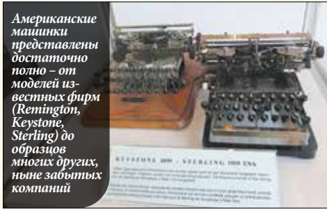
Американские машинки представлены достаточно полно – от моделей известных фирм (Remington, Keystone, Sterling) до образцов многих других, ныне забытых компаний