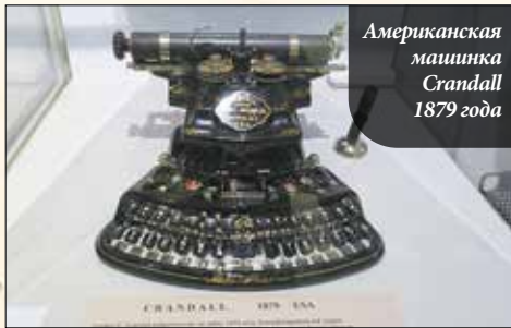
Американская машинка Crandall 1879 года