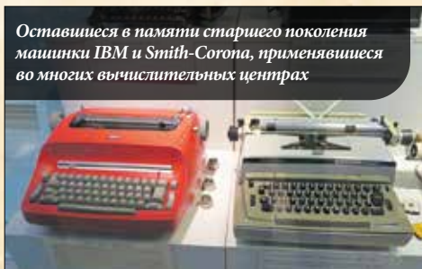
Остались в памяти старшего поколения машинки IBM и Smith-Corona, применявшиеся во многих вычислительных центрах