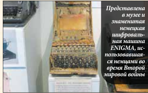
Представлена в музее и знаменитая немецкая шифровальная машина ENIGMA, использовавшаяся немцами во время Второй мировой войны

да его жена приболела, для облегчения ее жизни он изобрел стиральную машину. Разумеется, из дерева!