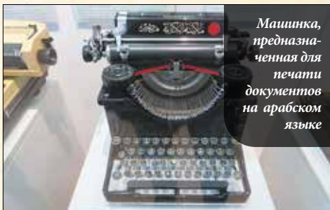
Машинка, предназначенная для печати документов на арабском языке