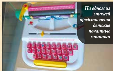
На одном из этажей представлены детские печатные машинки