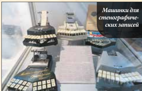
Машинки для стенографических записей