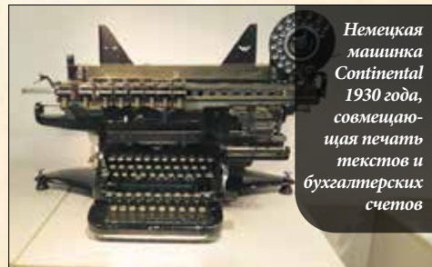
Немецкая машинка Continental 1930 года, совмещающая печать текстов и бухгалтерских счетов