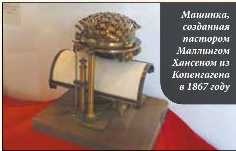
Машинка, созданная пастором Маллингом Хансеном из Копенгагена в 1867 году