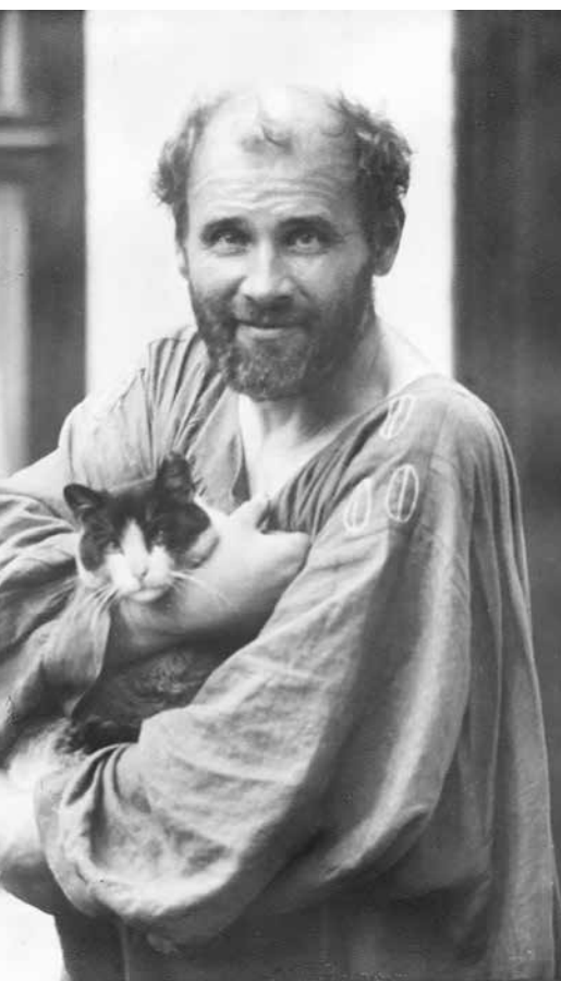
▲ Густав Климт. 1910. Фотография Морица Нера.