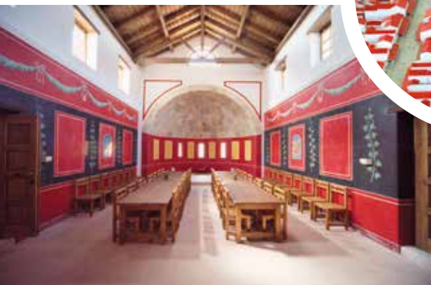
◀ Карнунтум, реконструкция интерьера древнеримской виллы