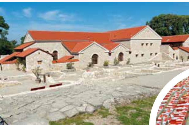
◀ Карнунтум, реконструкция древнеримской термы