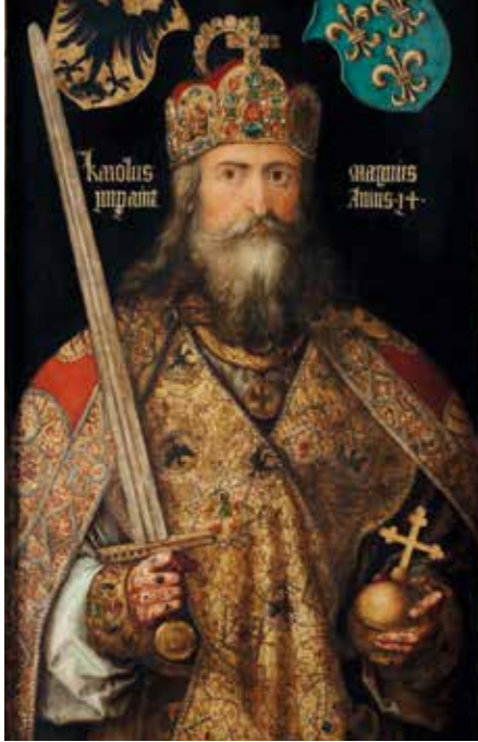
▲ Карл Великий

Главной достопримечательностью Гурка является собор Успения Пресвятой Богородицы, построенный в романском стиле в 1140 г. Его башни имеют высоту 60 метров. В церкви находится крипта с многочисленными колоннами, а также хранятся мощи святой Эммы.