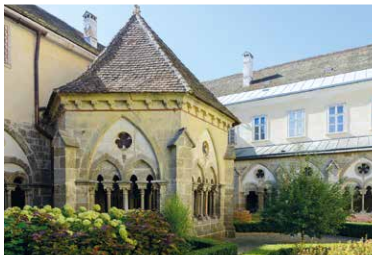
▲ Аббатство Цветль, готический дворик монастыря