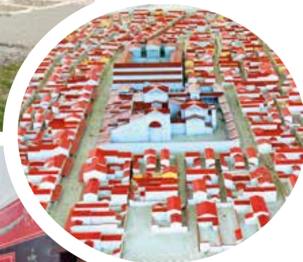
▲ Карнунтум, макет поселения