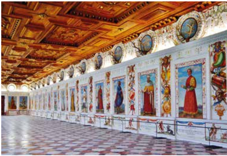
▲ Замок Амбрас в Инсбруке и его Испанский зал