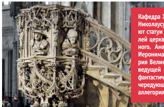
Кафедра XV века приписывается Николаусу Герхардту. Ее украшают статуи четырех первых учителей церкви – Августина Блаженного, Амвросия Медиоланского, Иеронима Стридонского, Григория Великого. Перила лестницы, ведущей на кафедру, украшены фантастическим орнаментом из чередующихся жаб и ящериц – аллегория борьбы добра и зла.