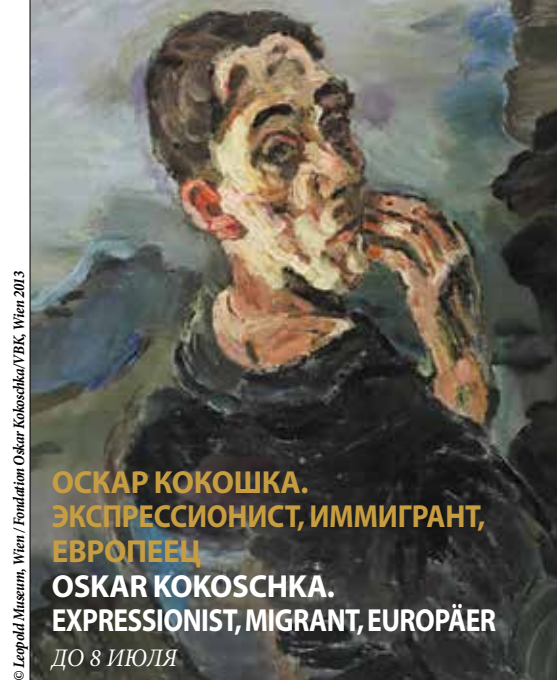
ОСКАР КОКОШКА. ЭКСПРЕССИОНИСТ, ИММИГРАНТ, ЕВРОПЕЕЦ OSKAR KOKOSCHKA. EXPRESSIONIST, MIGRANT, EUROPÄER ДО 8 ИЮЛЯ

Время работы: ежедневно – с 10 до 18, вторник – выходной день www.theatermuseum.at