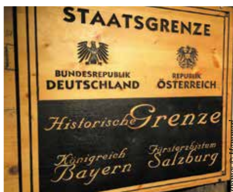
▲ Вход в соляные пещеры Халляйна

В шахтах от былых времен сохранились только стены, но экскурсия не ограничивается скучным осмотром поверхностей, о чем позаботились сотрудники музея. Съезжая на тобогганах с соляных гор