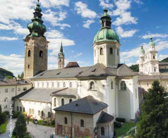
▲ Монастырь Святого Петра