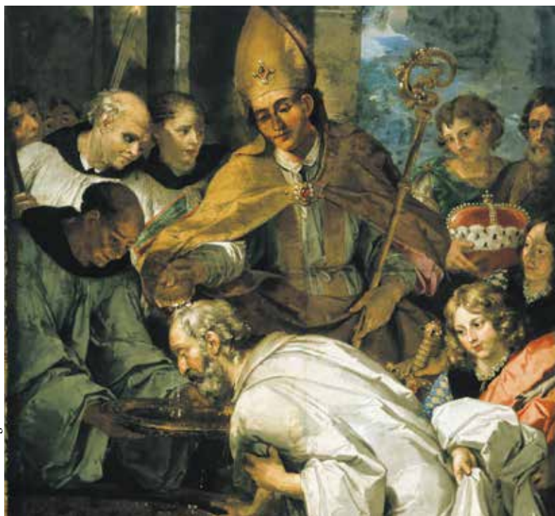
▼ Святой Руперт крестит герцога Теодора II Баварского