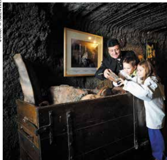
▲ Температура в соляных копях – 7–10 °С

На определенных участках пути установлены постоянно действующие фотокамеры, чтобы на выходе экскурсанты могли приобрести снимки, выбрав наиболее удачные собственные изображения.