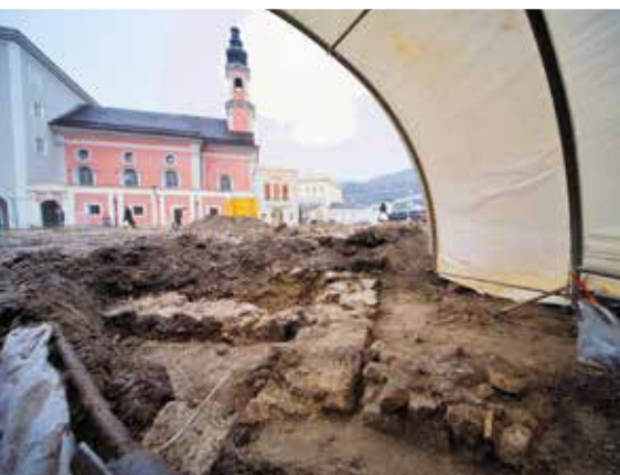
◀ Раскопки римского поселения в центре Зальцбурга на Резиденцплац