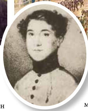
◀ Несчастный племянник Бетховена