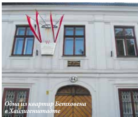
Одна из квартир Бетховена в Хайлигенштадте

но вообразить». На стульях высились горы тарелок с объедками, а на спинках висела ношенная одежда. Фортепиано и письменный стол были завалены незаконченными, испещренными чернильными кляксами партитурами. А под фортепиано уютился неопорожненный ночной горшок.