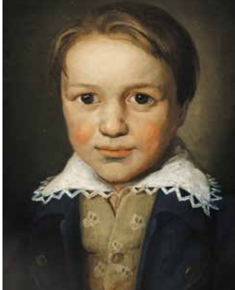
▲ Портрет 13-летнего Бетховена. 1783

Тем временем друзья Бетховена начали замечать, что он избегает бывать в обществе. Гайдн жаловался, что Людвиг к нему больше