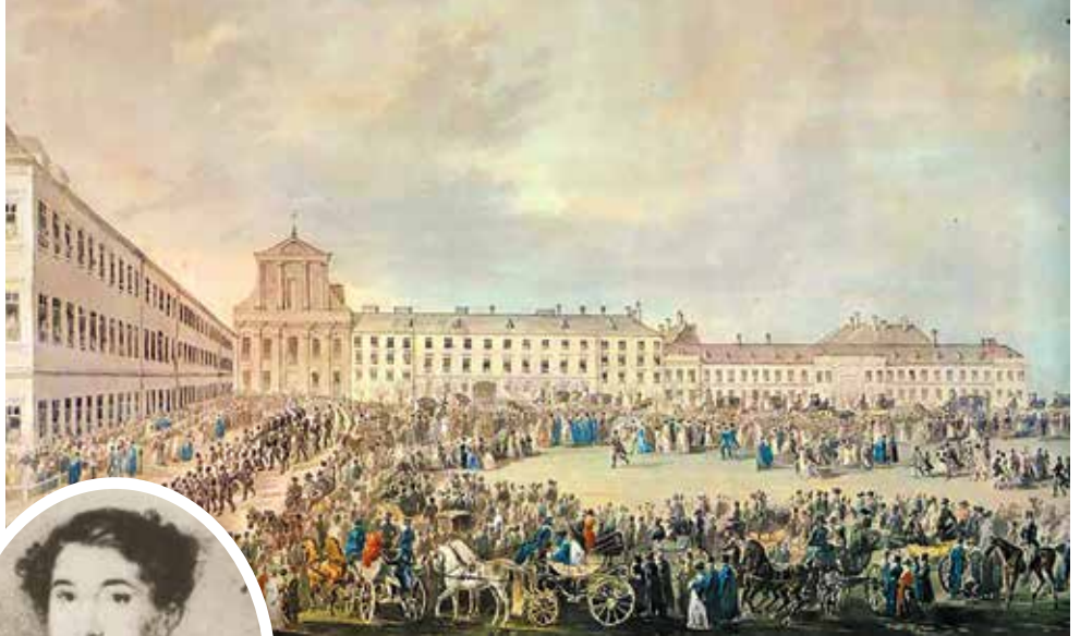
▲ На похороны композитора пришли более 10 тыс. человек