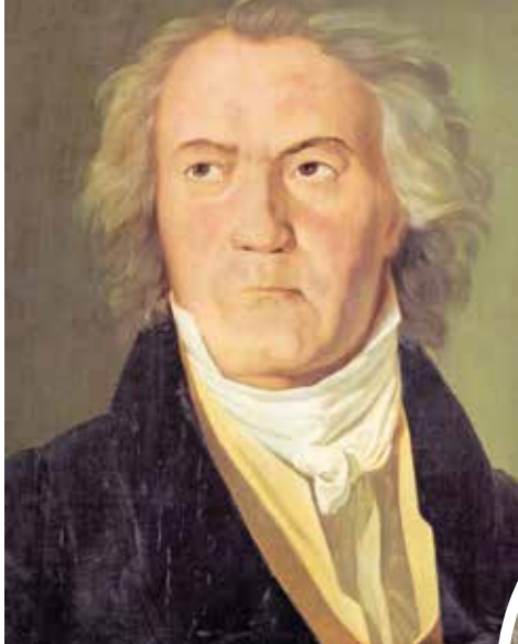
▲ Бетховен в год премьеры Девятой симфонии