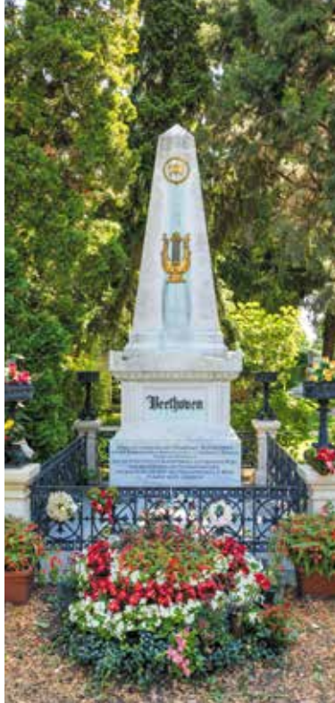
▲ Памятник Бетховену в Вене и его могила на Центральном кладбище