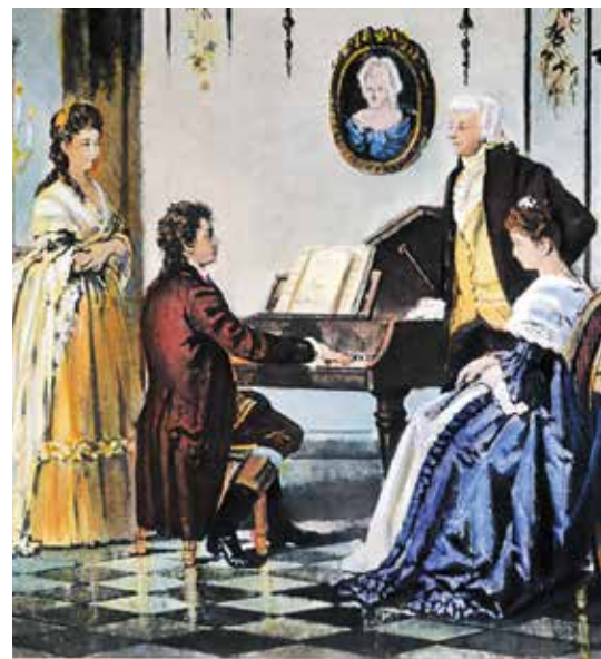
▼ Бетховен и Моцарт

КРОМЕ НАДВИГАВШЕЙСЯ ГЛУХОТЫ КОМПОЗИТОР МАЯЛСЯ И ДРУГИМИ НЕДУГАМИ: КИШЕЧНЫМИ КОЛИКАМИ, ПРИСТУПАМИ ДИАРЕИ И ЧАСТЫМИ ГОЛОВНЫМИ БОЛЯМИ. БЕТХОВЕН ТАК ИЗМУЧИЛСЯ, ЧТО ПОДУМЫВАЛ СВЕСТИ СЧЕТЫ С ЖИЗНЬЮ. ОТ САМОУБИЙСТВА ЕГО УДЕРЖИВАЛА ТОЛЬКО ИСТОВАЯ ВЕРА В СВОЕ ПРЕДНАЗНАЧЕНИЕ.