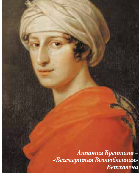
Антония Брентано – «Бессмертная Возлюбленная» Бетховена

Бетховен нигде не жил подолгу, в Вене он сменил сорок квартир. Случалось, снимал четыре различных помещения одновременно. Жильцом он был, мягко выражаясь, не из приятных. Один из посетителей, навестивший его в 1809 году, сообщал, что композитор живет «в самой грязной и захлавленной квартире, какую только мож-