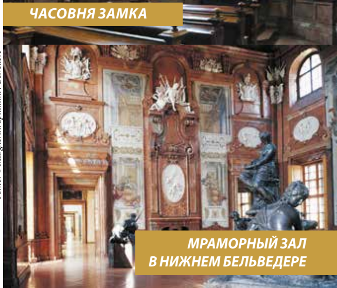
МРАМОРНЫЙ ЗАЛ В НИЖНЕМ БЕЛЬВЕДЕРЕ