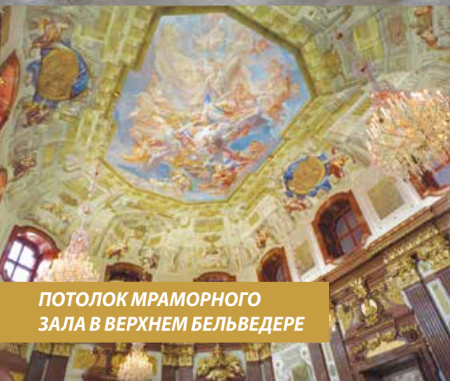
ПОТОЛОК МРАМОРНОГО ЗАЛА В ВЕРХНЕМ БЕЛЬВЕДЕРЕ