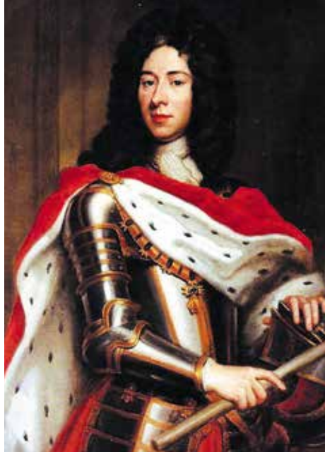
▲ Принц Евгений Савойский

В феврале 1683 года юный принц решил начать военную карьеру и заявил о своем желании вступить во французскую армию. При этом он не нашел поддержки ни со стороны своей бабушки, ни со стороны французского короля, в результате чего отправился, как прежде его старший и к этому времени погибший брат Луи-Жюль, к кайзеру Леопольду I и предложил тому свои услуги. В 1683 году огромное турецкое войско под руководством Кара-Мустафы обложило Вену, поэтому кайзер Леопольд I охотно зачислил принца в свою армию. А Евгений затем принял участие в битве за столицу под командованием своего немецкого кузена – маркграфа Людвига Баденского. С этого момента ничто не могло помешать блестящей военной карьере принца Савойского. Первыми его успехами считаются захват Пешта и Офена, взятие Белграда и победоносная битва