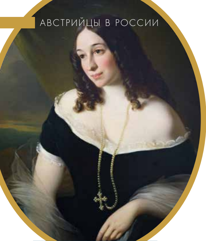
Портрет Дарьи Сипягиной, 1855