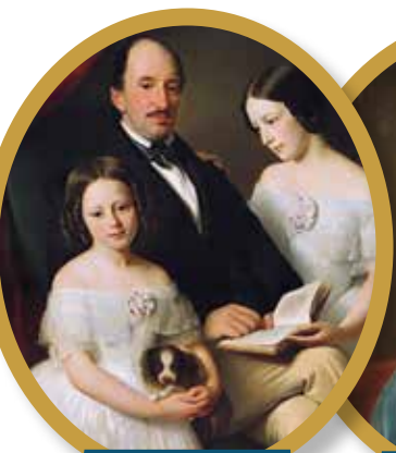
Портрет Болеслава Потоцкого с дочерью Марией и воспитанницей Софьей