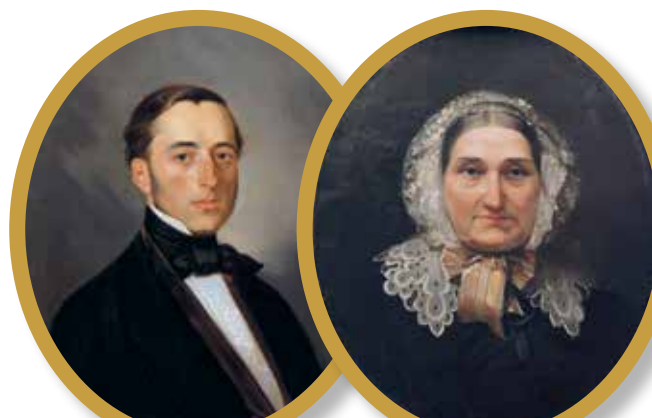
Портрет неизвестного мужчины