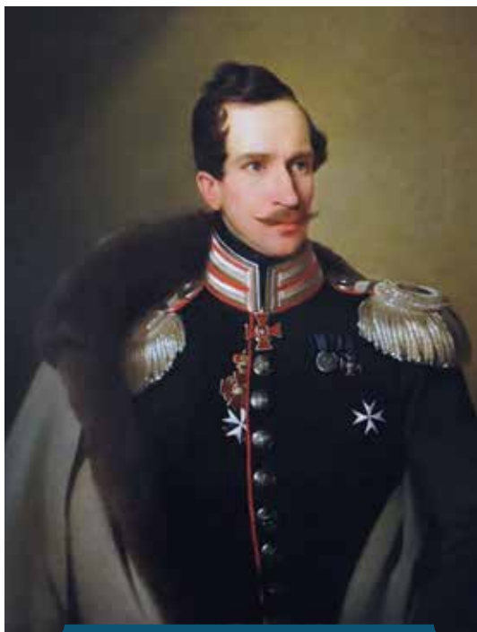
Портрет князя Михаила Голицына