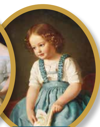
Портрет сидящей девочки с книгой, 1851