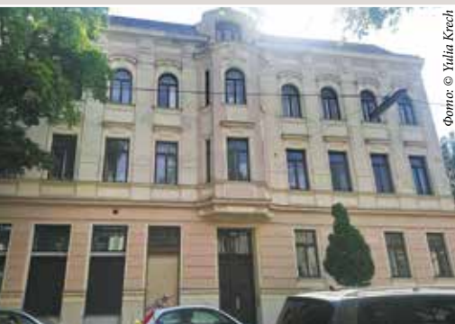
▲ Фридельгассе, дом 40