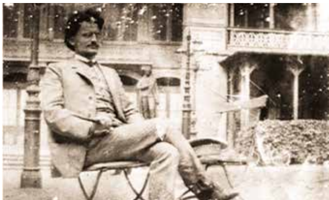
▲ Троцкий в Вене