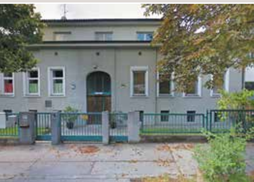
▲ Хюттельбергштрассе, дом 55