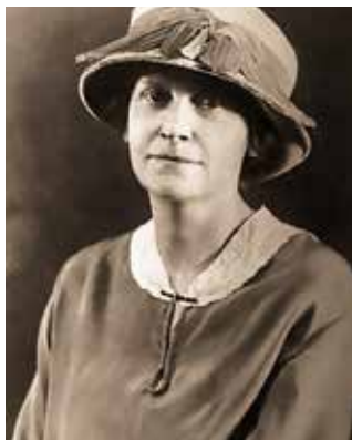
▲ Наталья Седова в 1910 г.