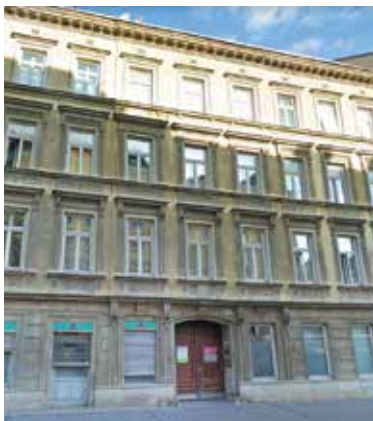
▲ Лазаретгассе 8, где размещались редакция и типография газеты «Правда». Троцкий в Вене читает газету «Правда»