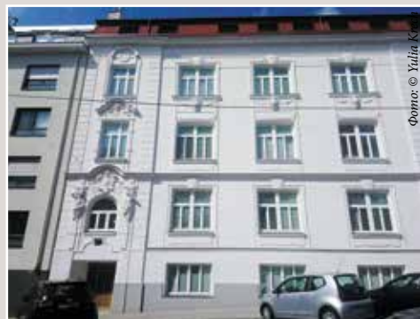
▲ Родлергассе, дом 25