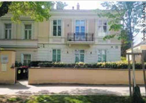
▲ Зиверингерштрассе, дом 19