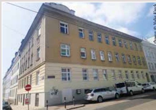
▲ Вайнберггассе, дом 43