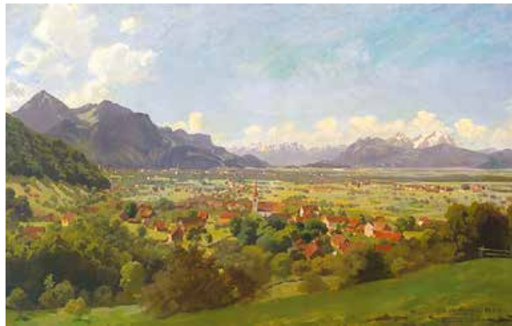
▲ Дорнбирн. 1886

Экономический подъем региона начался после обретения