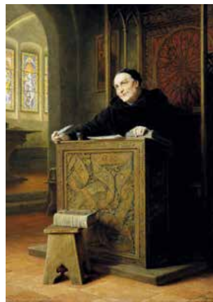
▲ Святой Отмар Галленский

личность – святой Отмар Галленский . Он был первым аббатом крупнейшего в те годы Санкт-Галленского монастыря . Благодаря его стараниям это аббатство стало важным религиозным центром. Именно из него 15 октября 895 года была отправлена небольшая записка, в которой впервые упоминалось поселение Торинпурион – в переводе «Суды Торро».