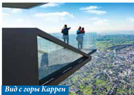
Вид с горы Каррен