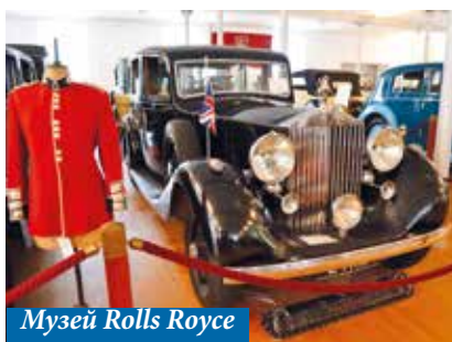
Музей Rolls Royce

Можно прогуляться по берегу реки Дорнбирнер Ах (Dornbirner Ach) , которая протекает через западную часть города.