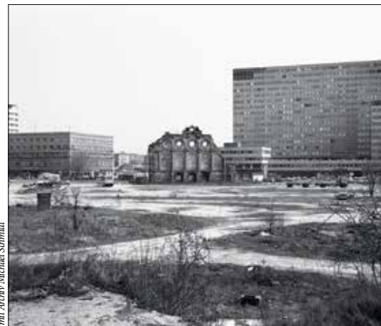
Leihgabe Karin Schmidt

Время работы: вторник – воскресенье – с 10 до 18, четверг – с 10 до 21, понедельник – выходной день www.khm.at