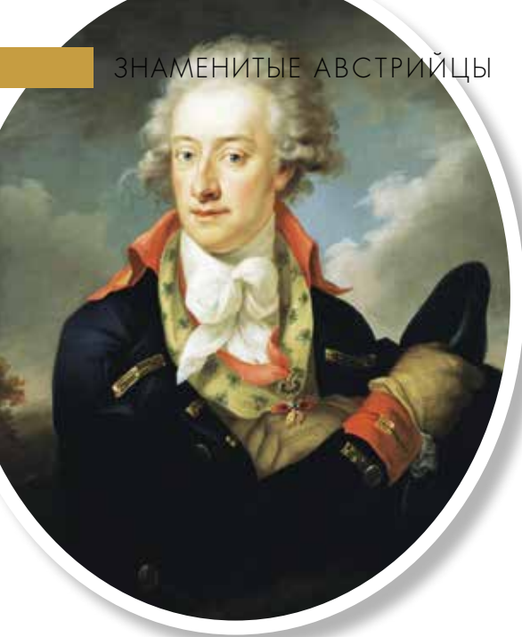
▲ Алоиз I фон Лихтенштейн. Портрет работы Петера Штрелинга, 1794 год