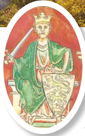
▲ Ричард Львиное Сердце

– Не могу донести вашему величеству, в котором часу началось сражение с фронта, но в Дюрнштейне, где я находился, войско начало атаку в 6-м часу