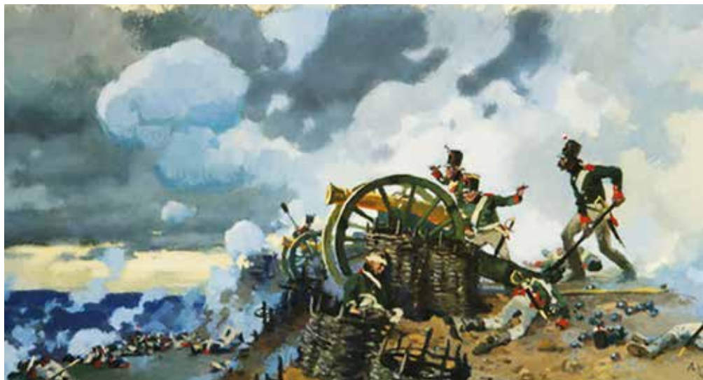
▲ Батарея капитана Тушина при Шёнграберне. Иллюстрация А. В. Николаева к роману «Война и мир» Льва Толстого.

Французы потеряли под Шёнграберном более двух тысяч человек. Наши потери составили 768 человек убитыми (в том числе 4 офицера), 711 пропавшими без вести (в том числе 3 офицера) и 929 ранеными (в том числе 3 офицера), из которых 737