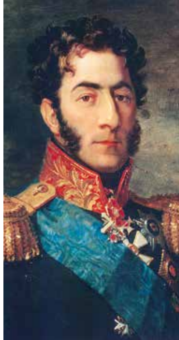
▲ П. И. Багратион