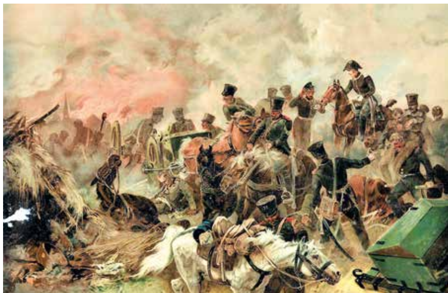
▲ Батарея капитана Тушина при Шёнграберне. Акварель Н. Н. Каразина («Война и мир» Льва Толстого).

Русской армии пришлось с боями отходить на восток от австрийско-баварской границы по правому берегу Дуная. Чтобы оторваться от преследования, русские перешли на левый берег реки и сожгли за собой мост. Благодаря данному маневру солдаты получили небольшую передышку. Правда, перед этим им пришлось при поддержке небольшого австрийского отряда разгромить крупное французское соединение маршала Мортье , который, как оказалось, уже поджидал Кутузова на левом берегу, под городом Дюрнитайн . Эта неожиданная