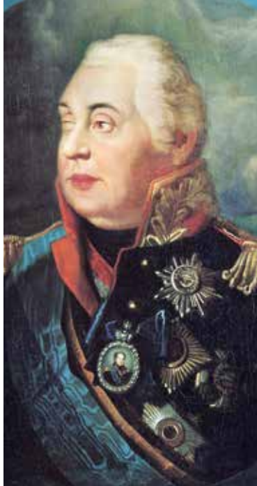
▲ М. И. Кутузов