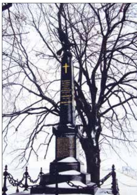
▲ Обелиск в честь погибших русских, австрийских и французских воинов в Шёнграбернском бою (при Холлабрунне).

«Невыспавшийся» Багратион во время боя преображается: «Лицо его выражало ту сосредоточенную и счастливую решимость, которая бывает у человека, готового в жаркий день броситься в воду и берущего последний разбег. Не было ни невыспавшихся тусклых глаз, ни притворно глубокомысленного вида: круглые, твердые, ястребиные глаза восторженно и несколько презрительно смотрели вперед...»