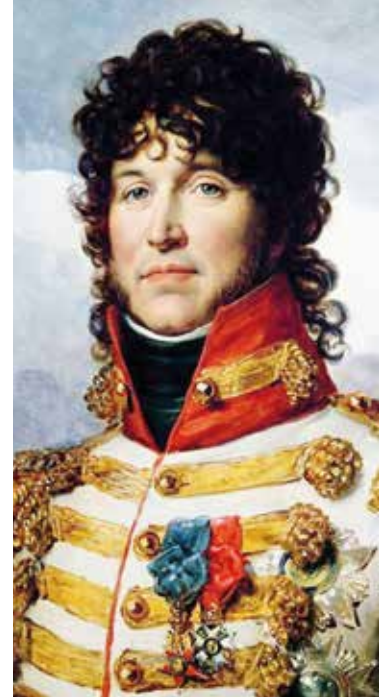
▲ И. Мюрат

хитрить. В результате русские должны были ускорить темпы отхода на север – к ставке союзников. Иначе окружения и разгрома было не миновать.