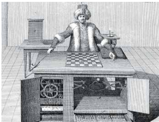
◀ Шахматный автомат Кемпелена.