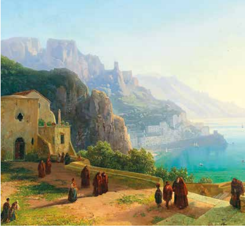
▲ Вид на побережье Амальфи