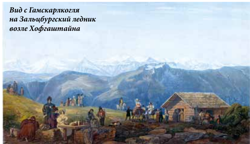
Вид с Гамскарлкогля на Зальцбургский ледник возле Хофгаштайна