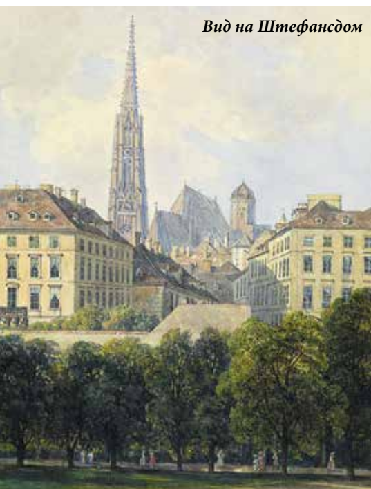
Вид на Штефансдом

художник-путешественник, любимец австрийской знати