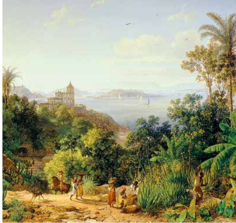
▲ Вид на Рио-де-Жанейро

варелей. После возвращения Эндер сопровождал Меттерниха в Рим и жил там до 1823 года, получая императорское жалование.