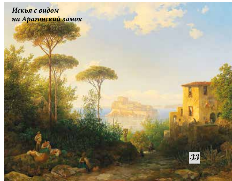
Искья с видом на Арагонский замок