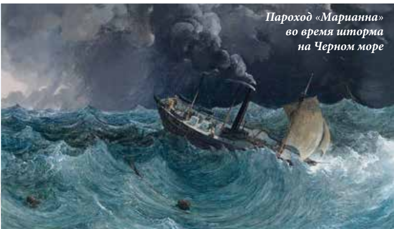
Пароход «Марианна» во время шторма на Черном море