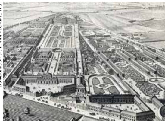
Бibliothek des Belvedere, Wien

Нижний Бельведер Unteres Belvedere Rennweg 6, 1030 Wien Время работы: ежедневно – с 10 до 18 www.belvedere.at