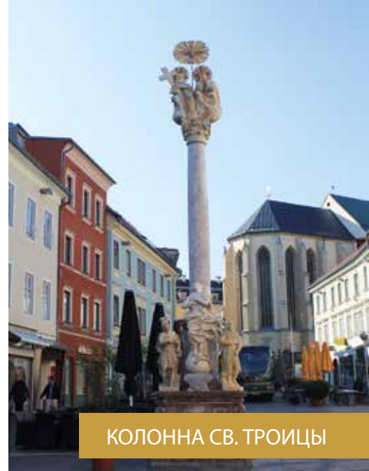
КОЛОННА СВ. ТРОИЦЫ