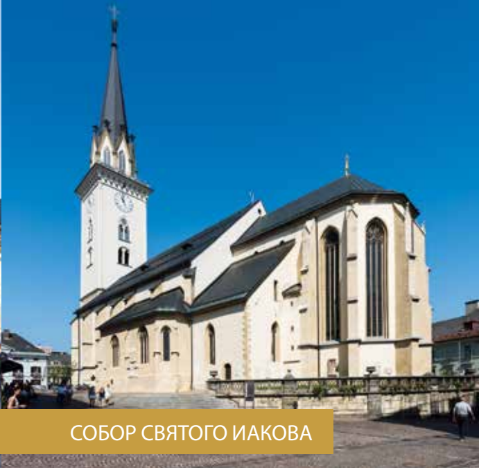
СОБОР СВЯТОГО ИАКОВА