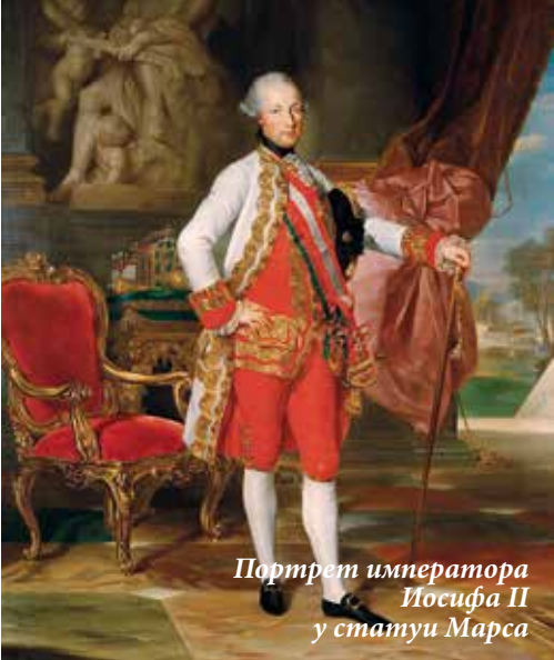
Портрет императора Йосифа II у статуи Марса