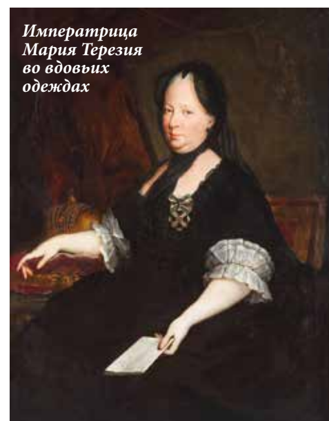
Императрица Мария Терезия во вдовьих одеждах