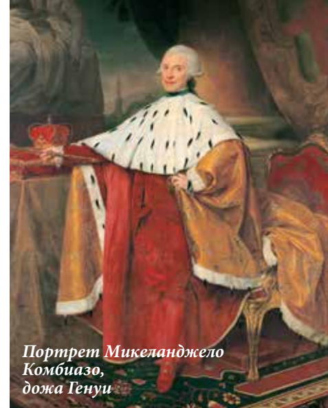
Портрет Микеланджело Комбиазо, дожа Генуи

ны ежегодные стипендии для обучения в Италии наиболее одаренных студентов.