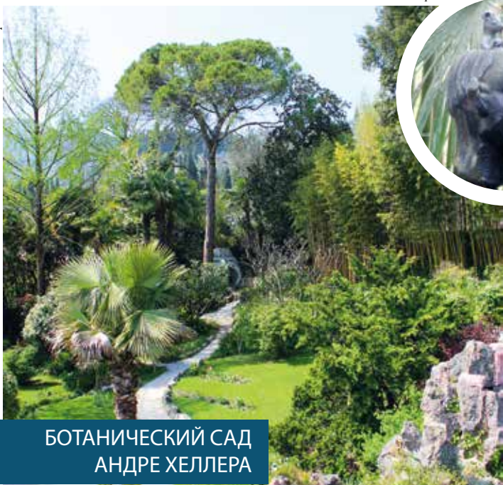
БОТАНИЧЕСКИЙ САД АНДРЕ ХЕЛЛЕРА