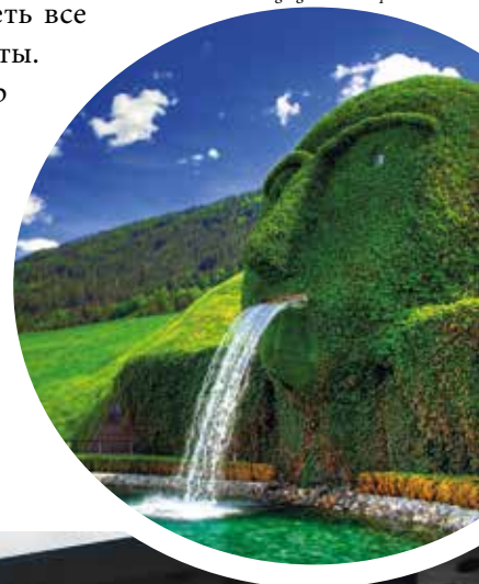
«ХРУСТАЛЬНЫЕ МИРЫ» АНДРЕ ХЕЛЛЕРА

Внутри великана находятся 17 комнат, в которых представлены ра-