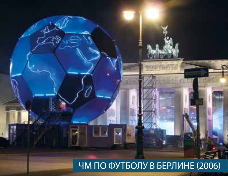
ЧМ ПО ФУТБОЛУ В БЕРЛИНЕ (2006)