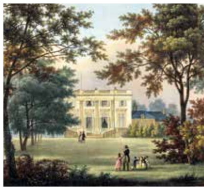
▲ Маленький Трианон.