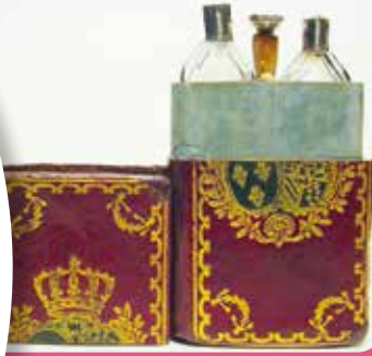
▲ Духи королевы.