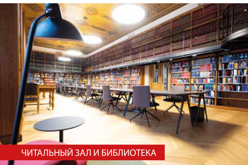
ЧИТАЛЬНЫЙ ЗАЛ И БИБЛИОТЕКА