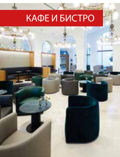
КАФЕ И БИСТРО