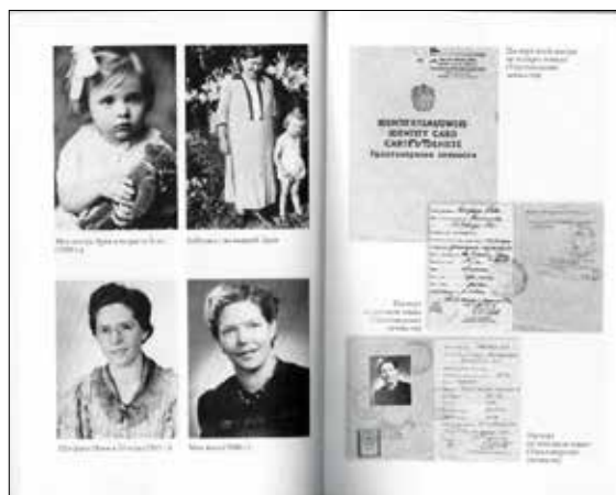
▼ Страницы книги Элеоноры Дюпуи

► Мама отметила в атласе город Калинин (Тверь) , в котором жил Михаил, по крайней мере, до войны .