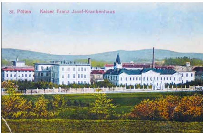
▲ Госпиталь города Санкт-Пёльтена