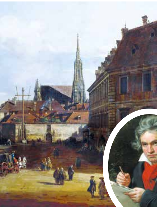
Людвиг Ван Бетховен

лось, что в ней «яркого и странного слишком много, вследствие чего обзор крайне затрудняется и почти совсем пропадает единство», и что «симфония выиграла бы бесконечно, если бы Бетховен решился ее сократить и привести к большей ясности и единству.»