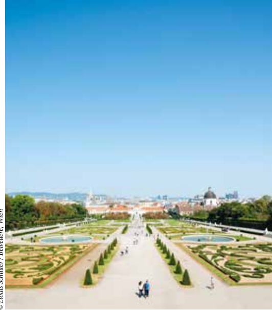
© Lukas Schaller / Belvedere, Wien

Время работы: ежедневно – с 10 до 19, вторник – с 14 до 19 www.westlicht.com