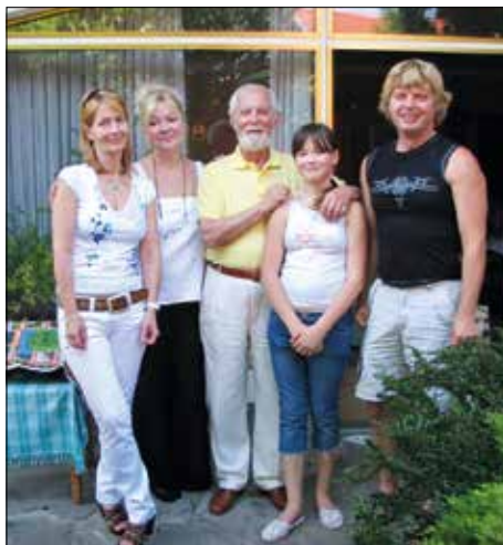
▲ С семьей на праздновании своего 75-летия. Зальцбург, 2007.

гастроли на оперных сценах Буэнос-Айреса, Чили, Колумбии . В Северной Америке я тоже выступал – в Сан-Франциско и Лос-Анджелесе. Но русскую музыку я бросить не мог. У меня был балалаечный оркестр из четырех человек, и мы ездили в турне по Евро-