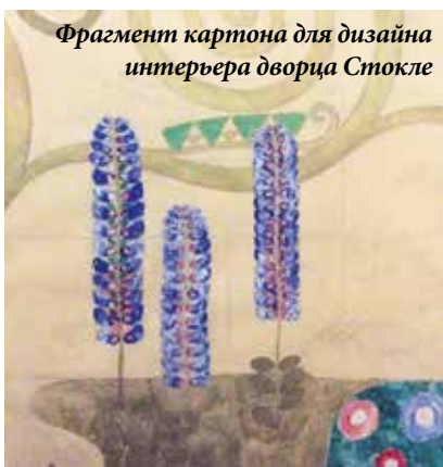
Фрагмент картона для дизайна интерьера дворца Стокле