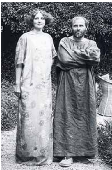
▲ Густав Климт и Эмилия Флэге.