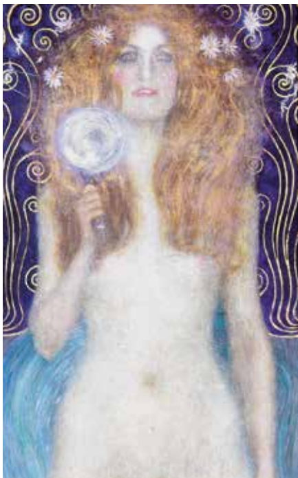
▲ Фрагмент «Нагой правды» Густава Климта в Музее театра во Дворце Лобковиц