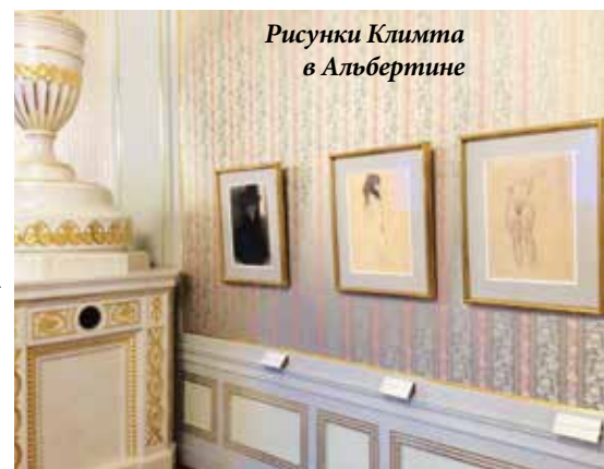
Рисунки Климта в Альбертине