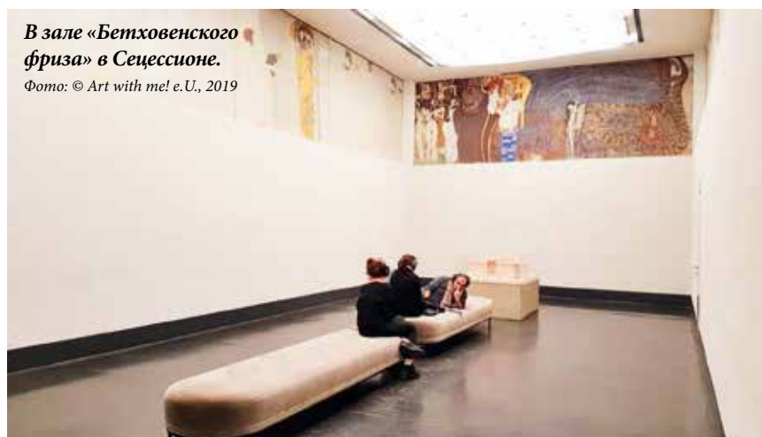
В зале « Бетховенского фриза » в Сецессионе.

Время работы: ежедневно, кроме вторника, – с 10 до 18 https://secession.at