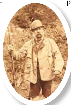
▲ Франц Иосиф I.

В 1827 году его посетили бездетная эрцгерцогиня София Баварская с мужем, императором Францем Карлом. Четверо сыновей, «соленые принцы» (Salzprinzen), которых она родила в последующие годы, послужили лучшей из возможных рекомендаций курорту.