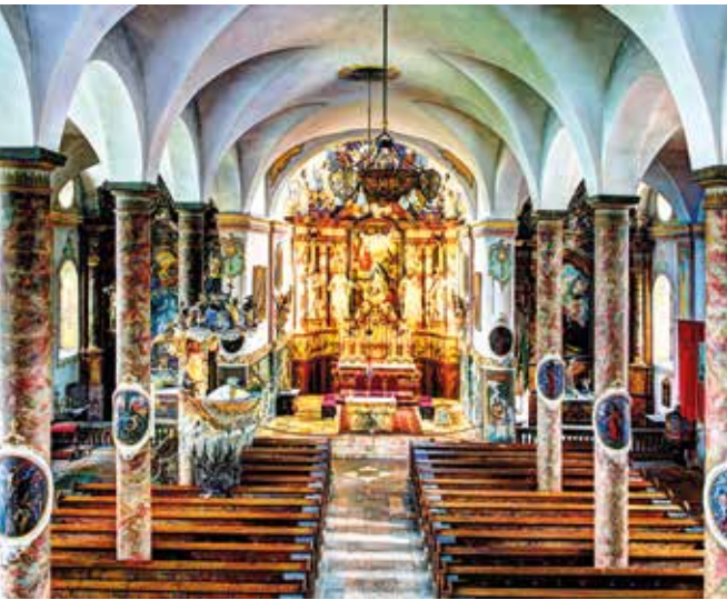
Фото: © Brainpark, Traunsee