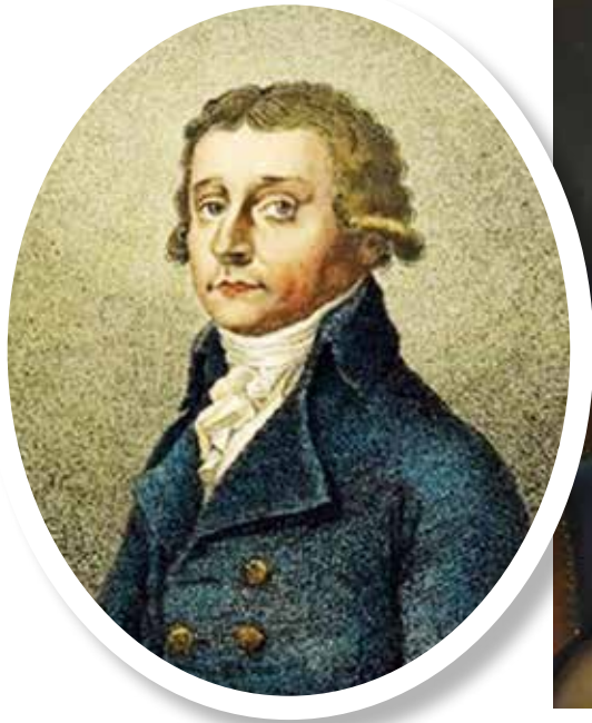
▲ Антонио Сальери, 1785 г.

Ради этого он устраивал благотворительные концерты, к которым привлекал известнейших