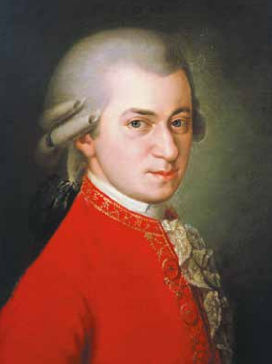
▲ Вольфганг Амадей Моцарт

мог тому включить в репертуар оперу «Свадьба Фигаро».