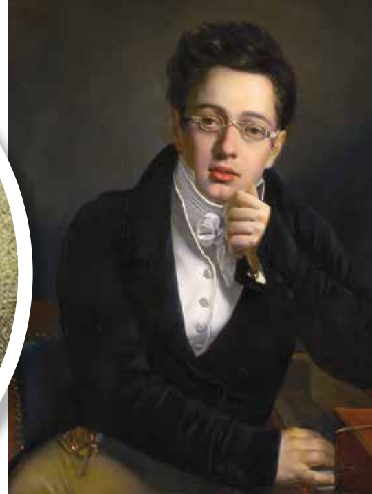
▲ Молодой Шуберт

С детства занимавшийся музыкой и пением в церковном