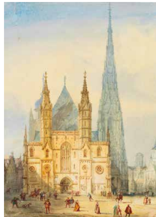
▼ Вена в XIX веке