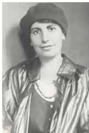
▲ Зигмунд и Анна Фрейд