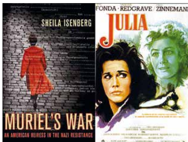
▼ Обложка книги «Война Мюриэль» и афиша фильма «Джулия»