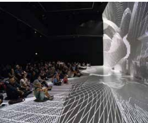
Фотом: Deep Space Music by NOHlab

Ars Electronica – это презентации дизайнерских компьютерных фильмов, рекламных роликов с продвинутыми