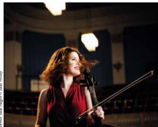
Фото: Julia Hagen © Julia Wesely

В австрийском городе Линце с 4 сентября по 11 октября 2023 года вновь пройдет ежегодный фестиваль, названный в честь композитора Антон Брукнера . В этом мероприятии при-