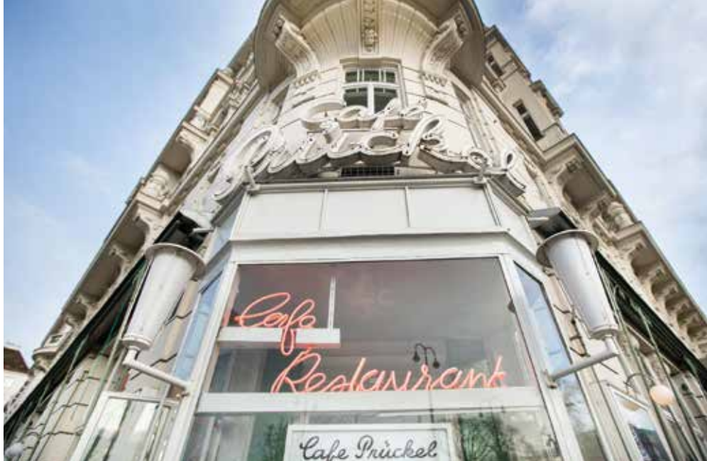
▲ Café Prückel. Фото: © Austrian National Tourist Office / Harald Eisenberger

Фото: © Austrian National Tourist Office / Harald Eisenberger