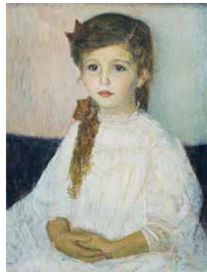
▲ Портреты Миры Бауэр, Терезы Блох-Бауэр и Беттины Бауэр. 1907 г. Холст, масло.