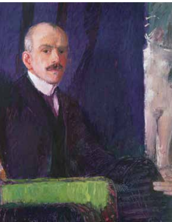
▲ Максимилиан Курцвайль (1867–1916). Автопортрет. 1910 г.