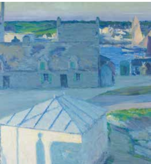
▲ Порт в Конкарно. 1900 г. Холст, масло.