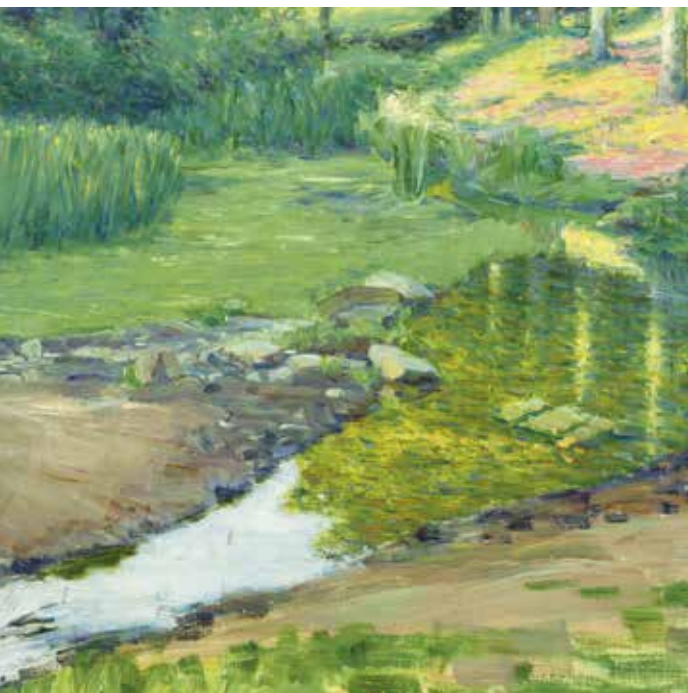
▲ У ручья. 1916 г. Холст, масло.