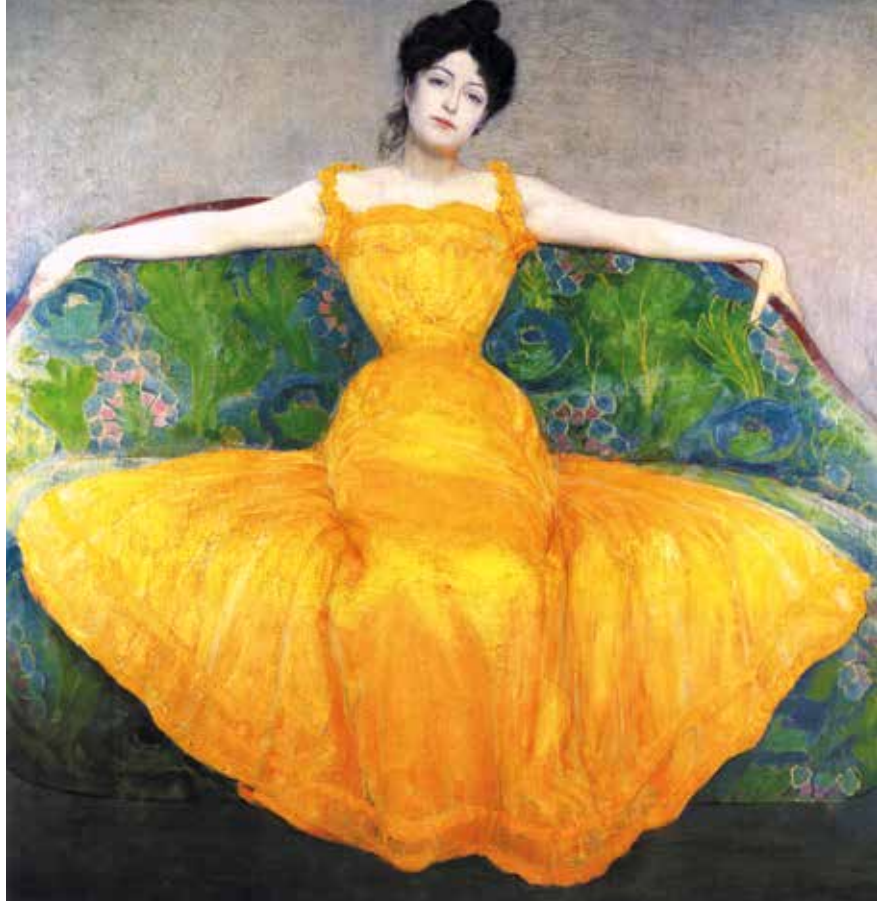
▲ Дама в желтом платье. 1899 г. Холст, масло.