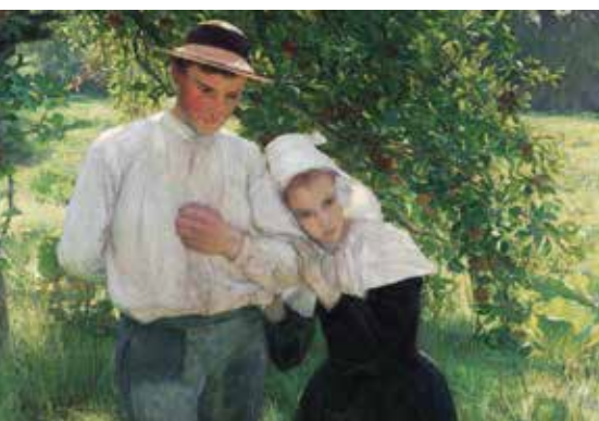
▲ Выздоровливающий. 1898 г.