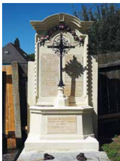
▲ Надгробный памятник Макс Курцвайлю и его семье на Хюттельдорфском кладбище в Вене.

Выставка Курцвайля в музее Бельведер, Вена, 2016 г.