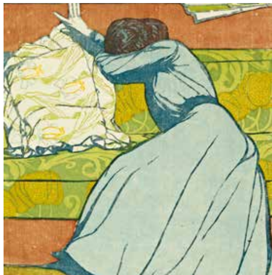
▲ Подушка I. 1903 г. Гравюра на дереве.