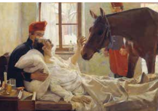
▲ Прощание с любимцем (Ein lieber Besuch). 1894 г. Картон, масло.