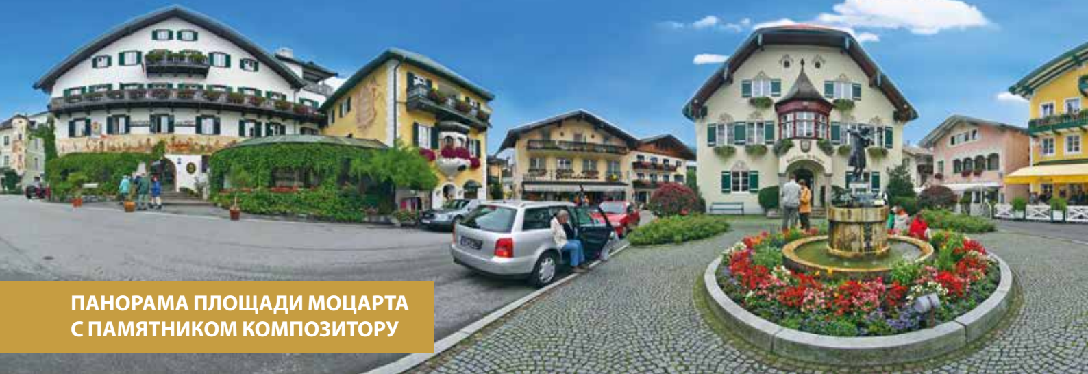
ПАНОРАМА ПЛОЩАДИ МОЦАРТА С ПАМЯТНИКОМ КОМПОЗИТОРУ