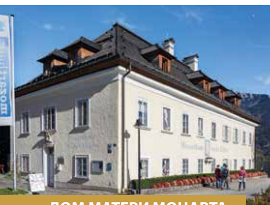
ДОМ МАТЕРИ МОЦАРТА