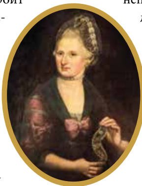
▲ Анна Мария – мать Вольфганга Амадея Моцарта.

и писатели. Местные жители особенно гордятся тем, что здесь работала бабушка и родилась мать Вольфганга Амадея Моцарта , а после замужества сюда переехала его сестра. И хотя сам Моцарт так ни разу