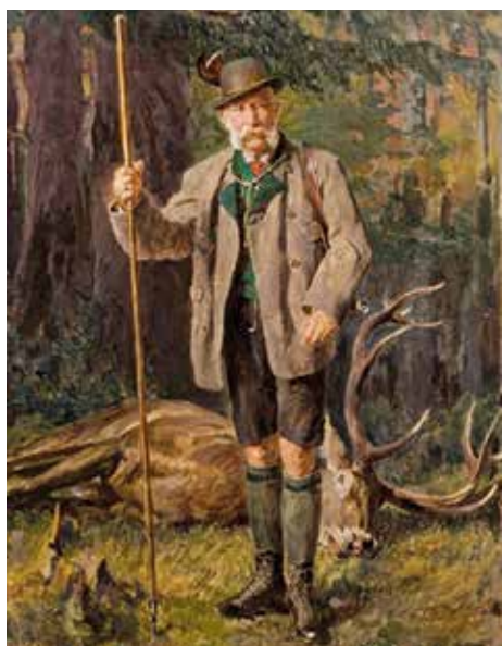
▲ Франц Иосиф I с трофеем. Ок. 1909 г.