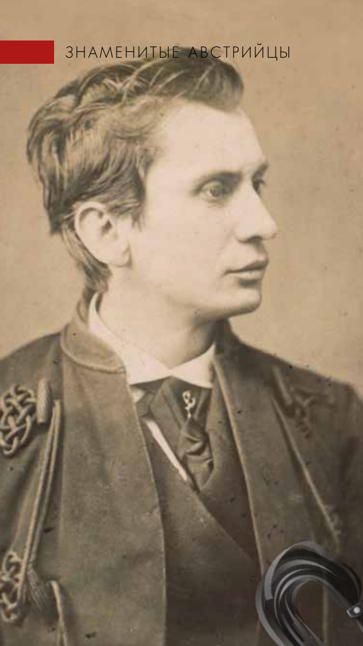
Leopold Ritter von Sacher-Masoch (1836-1895), Schriftsteller, um 1875