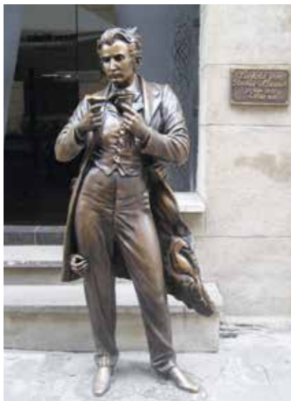
▲ Памятник Захер-Мазоху перед входом в «Мазох-кафе» во Львове.