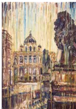
«На страже Истории и Права»