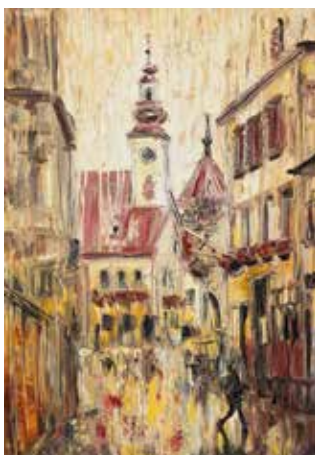
«В поисках вдохновения»

Меня очень вдохновили витражи в старинных венских соборах. Музыка и молитвы в сочетании с сиянием света в цветных стеклах витражей воплотились в моих картинах-витражах «Преображение» и